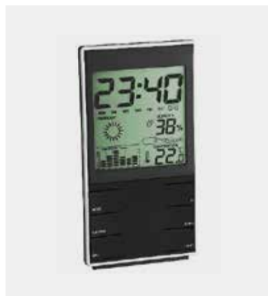
Geschenk 2: Wetterstation