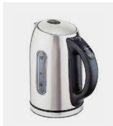
Geschenk 3: Wasserkocher