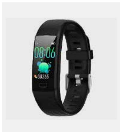
Geschenk 1: Wellcraft-Fitnesstracker

Informationen zu «Mitglieder werben Mitglieder» finden Sie unter: www.hev-luzern.ch