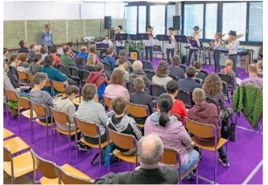
Neben 181 Solistinnen und Solisten sowie 28 Duetten werden auch acht Ensembles mit ihrem Vortrag das Publikum begeistern. ZVG

Am Samstag, 8. Februar, findet der jährliche Solo-, Duett- und Ensemblewettbewerb SWO in Oberkirch statt. Teilnahmeberechtigt sind Musikschüler und Musikschülerinnen der Musikschule Region Sursee, der Musikschule oberer Sempachersee und der Musikschule Nottwil. 181 Solistinnen und Solisten, 28 Duette wie auch acht Ensembles haben sich für den 21. SWO angemeldet. In 33 Kategorien messen sich die Kinder und Jugendliche im Alter von 7 bis 20 Jahren. Der Zeitplan des Wettbewerbs ist auf der Homepage der Musikschule Region Sursee unter www.m-r-s.ch ersichtlich. Der Eintritt beträgt fünf Franken. Kinder und Jugendliche sind gratis. Sämtliche Wettspiellokale befinden sich in der Schulhausanlage Oberkirch und dem Pfarreisaal. Die Festwirtschaft in der Kaffeestube ist ab 8 Uhr bis zum Ende des Wettbewerbs geöffnet. MGT