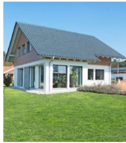
Bei vielen Häusern ist die effizienteste Energiesparmassnahme eine neue Heizung.

In der Praxis zeigt sich aber, dass viele Hauseigentümer aus Kostengründen nicht alle wünschenswerten Energiesparinvestitionen gleichzeitig umsetzen können. Dazu Ruedi Meier: «Wer in effiziente Energiesparmassnahmen investieren will, der sollte