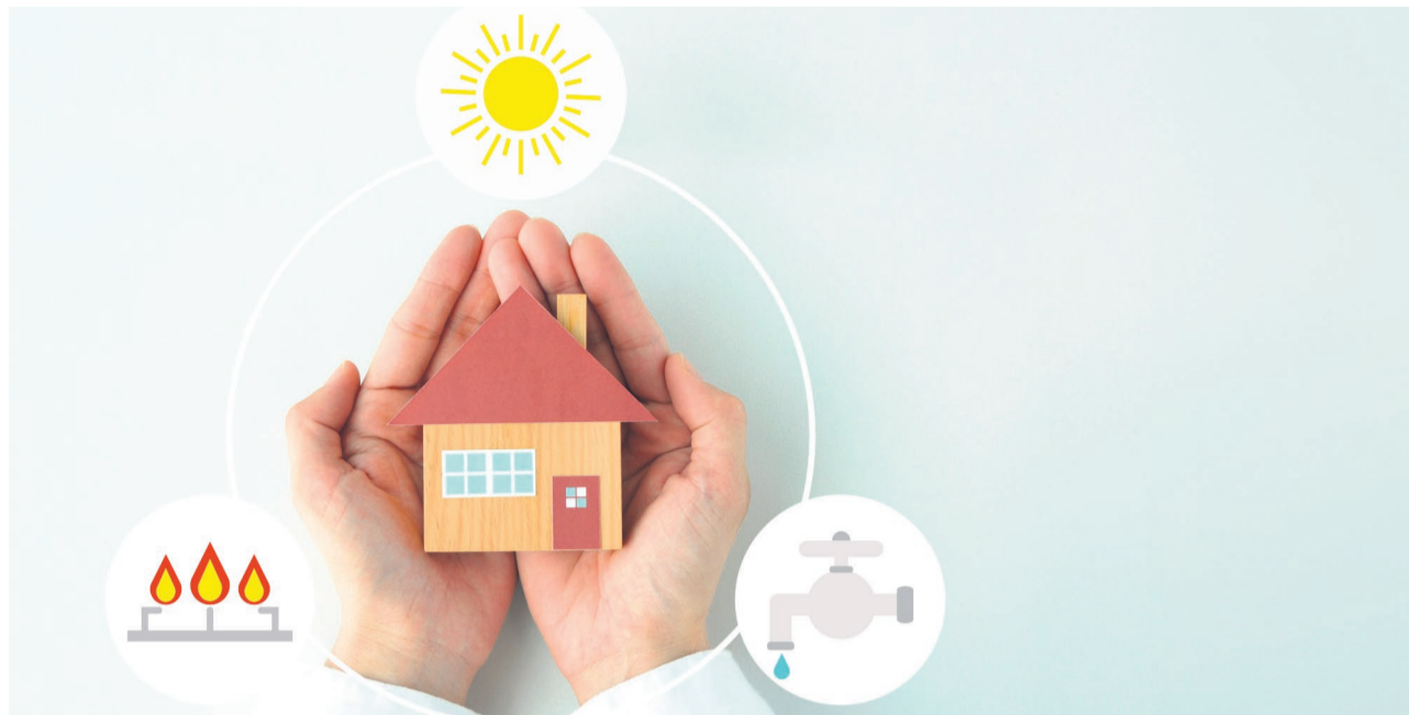
Die Wärmeerzeugung der Zukunft setzt auf innovative Technologien, erneuerbare Energien und nachhaltige Lösungen.

Die Wärmepumpen-Technologie hat in den letzten Jahren erhebliche Fortschritte gemacht. Neue Modelle sind nicht nur effizienter, sondern bieten auch zusätzliche Funktionen wie die aktive Kühlung.